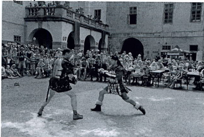
Fotogalerie, příloha č. 1: